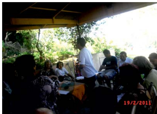
EQUIPE DE COORDENAÇÃO FCD CAXIAS

À tarde, muita música, comida, conversas. Um tempo mais livre, pois acreditamos que é na espontaneidade que os laços de amizade são fortalecidos. Certamente, foi um dia para “cultivar” o carisma da Frater e iniciar com novo vigor este ano jubilar para a FCD Caxias.